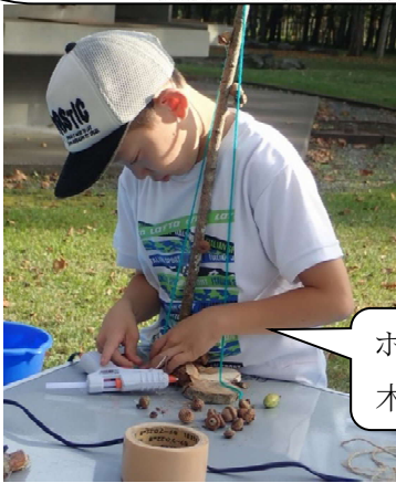
ホットボンドをつかった木の実クラフト