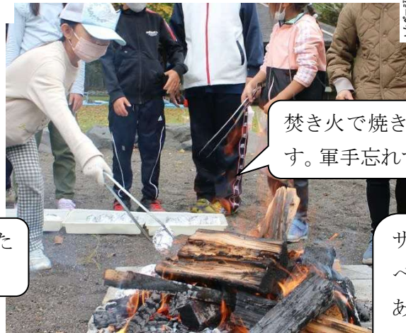
焚き火で焼き芋づくりします。軍手忘れずに！