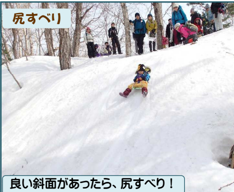
良い斜面があつたら、尻すべり!