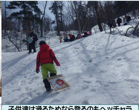
子供達は滑るためなら登るのもヘツチャラ