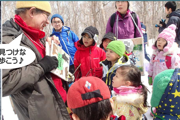
色々見つけな がら歩こう♪