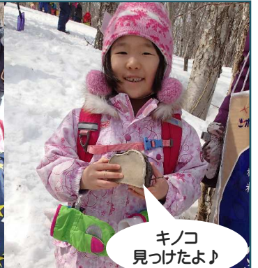
キノコ 見つけたよ♪