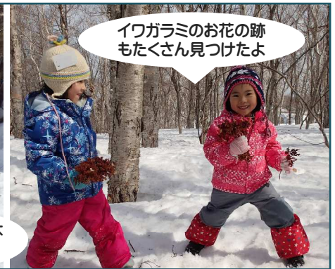
イワガラミのお花の跡 もたくさん見つけたよ