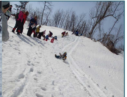
春山ならではのダイナミックな滑りです!