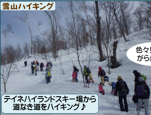
テイネハイランドスキー場から 道なき道をハイキング♪