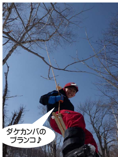
ダケカンバの ブランコ♪