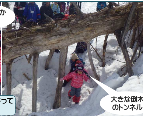
大きな倒木 のトンネル