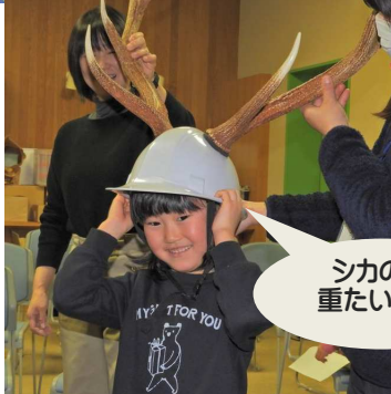
シカの角 重たいね～