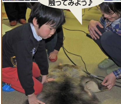
シカの毛 触ってみよう♪