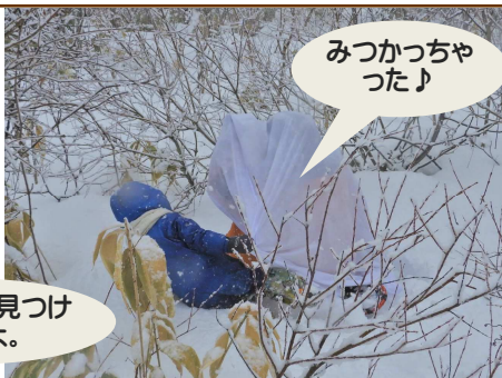
みつかっちゃ った♪