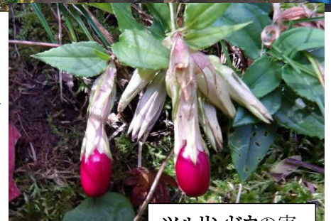
ツルリンドウの実