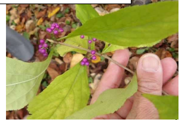
ムラサキシキブの実