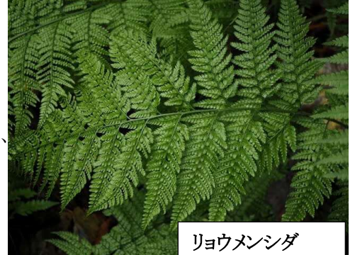
リョウメンシダ 美しいシダです