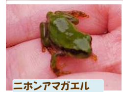
ニホンアマガエル