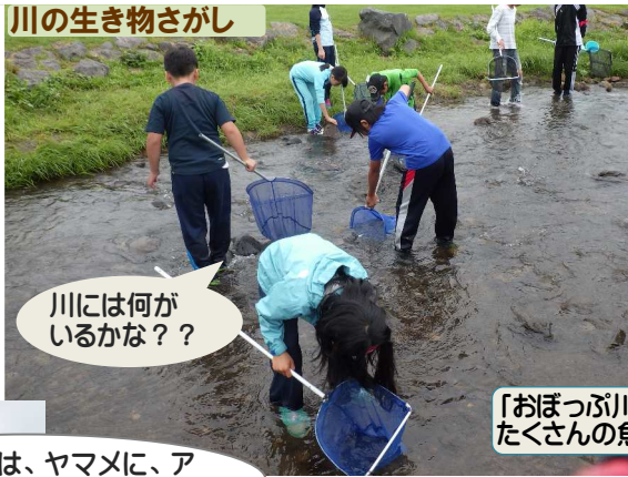
川の生き物がさし