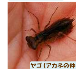
ヤゴ (アカネの仲間)