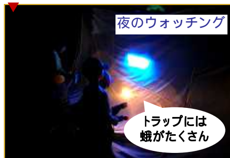
夜のウォッチング