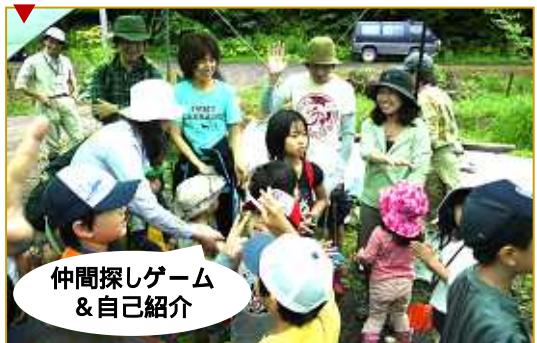
仲間探しゲーム & 自己紹介

はじめにオリエンテーション。キャンプの日程や八サンベツの里山についての説明を聞きました。