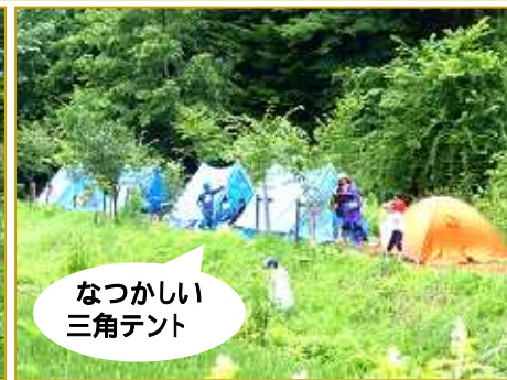
なつかしい 三角テント

★★ いよいよキャンプ開始！まずはテントの設営。あいにくの雨の中りっぱなお家できました。