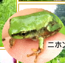
ニホンアマガエル