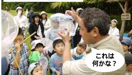
昆虫の解説 by むらさん